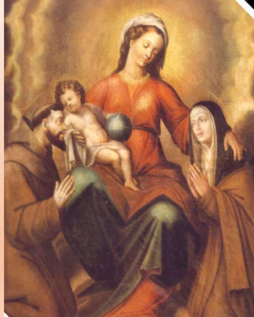
La Virgen con el niño, San Francisco y Santa Clara, 1602. Es la pintura colonial fechada más antigua en Chile y se ubica en el Monasterio de las Clarisas de Puente Alto

Se denomina Arte colonial o Arte Americano de la Colonia a la producción artística desarrollada durante el período colonial, comprendido entre los siglos XVI y XVIII. Se caracterizaba por ser el resultado de la fusión de visiones de mundo y técnicas pictóricas de los conquistadores españoles y los aborígenes americanos. El arte fue un medio muy importante de evangelización. Por medio de este se educó al pueblo, dando a conocer las sagradas escrituras y las enseñanzas de Jesús. Para llevar a cabo este trabajo, y en su afán evangelizador, la corona española envió artistas y artesanos.