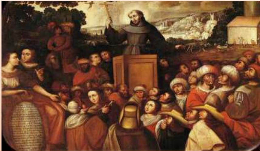
“El milagro de las golondrinas” Obra de Basilio de Santa Cruz, realizada en 1680.